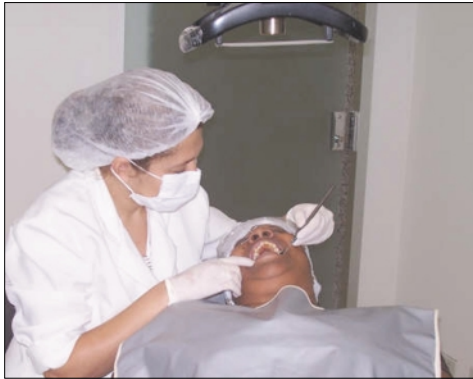
Novos tipos de tratamentos